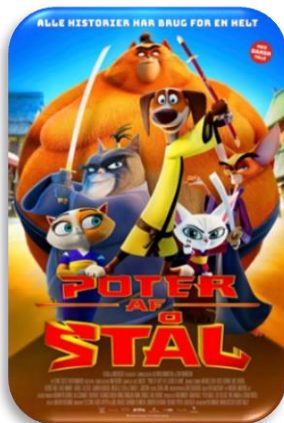
1 time 50 min. 20.1.2024