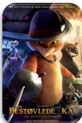
1 time 55 min. 24.2.2024