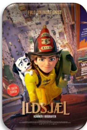
1 time 45 min. 28.10.2023