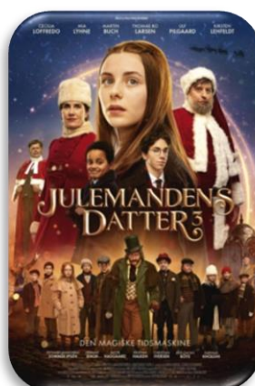
1 time 50 min. 18.11.2023